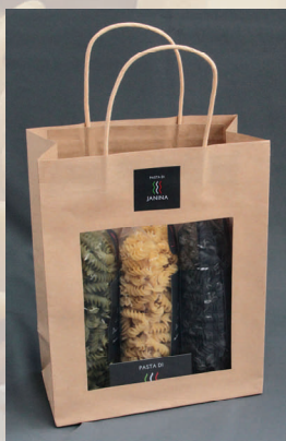
Geschenkvariation groß 3 x 200 g diverse Sorten