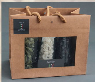
Geschenkvariation klein 3 x 100 g diverse Sorten